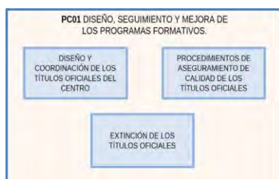
Figura 3. Actividades del PC01.

Los indicadores y registros/evidencias estarán definidos en el PC01.