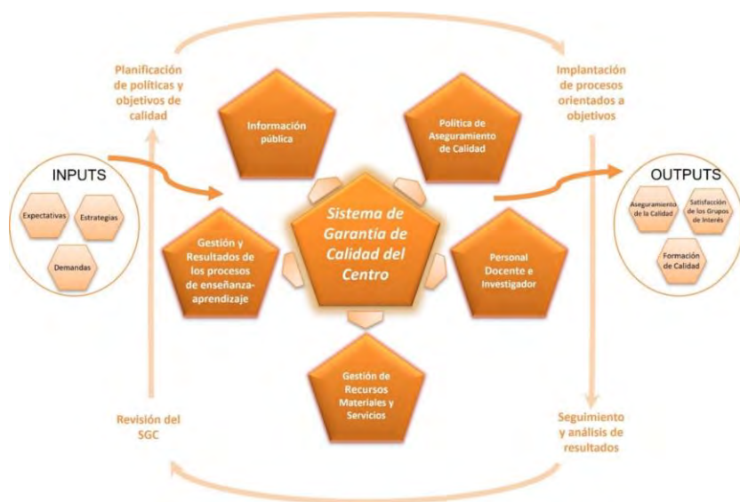
Figura 1. Esquema de Ciclo de Mejora Continua en el SGCC de la UCO.

En este sentido, el SGCC de la Universidad de Córdoba contemplará la planificación, evaluación y revisión de su implantación, así como la toma de decisiones basada en el análisis del sistema en aras de una mejora continua, tal y como se representa en la Figura 1.