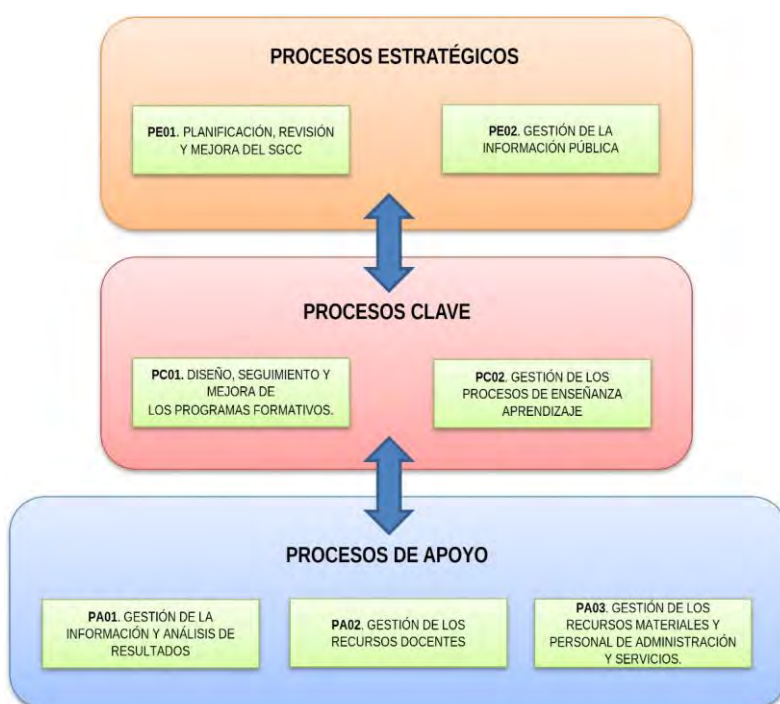
Figura 2. Mapa de Procesos del SGCC de la UCO.

Para cada uno de estos procesos se han definido una serie de procedimientos comunes para todos los centros. En el apartado 3.6 de este manual se describe la finalidad de cada uno de los procedimientos. Asimismo, para algunos de estos procedimientos, se definen las actividades que necesariamente deben desarrollar los centros, sin perjuicio de que se incluyan otras específicas atendiendo a las singularidades de cada centro y, vinculándose a algunos de los procedimientos que se describen a continuación: